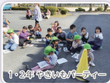
1・2年 やきいもパーティー

生活様式の変化とともに価値観も多様化してきているが、地域の人々は温和・純朴で、学校の教育活動に対して、たいへん熱心で協力的である。特に、平成31年のコミュニティ・スクール制度導入後には、学校支援ボランティアが年々増え、現在（令和4年12月）35人の方々が学校の様々な活動を支援してくださっている。